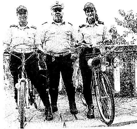
Alcuni momenti dell'escursione in bici che ha coinvolto molti adulti, tanti bambini e anche i sindaci