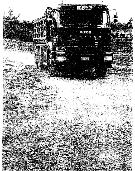
La variante di via Grevigiana è ancora da completare: intanto il tempo passa, come i camion, ma l'asfalto non si vede

2 3 4 5 6 7 8 9 10 11 12 13 14 15 16 17 18 19 20 21 22 23 24 25 26 27 28 29 30 31 32 33 34 35 36 37 38 39 40 41 42 43 44 45 46 47 48 49 50 51 52 53 54 55 56 57 58 59 60 61 62 63 64 65 66 67 68 69 70 71 72 73 74 75 76 77 78 79 80 81 82 83 84 85 86 87 88 89 90 91 92 93 94 95 96 97 98 99 100